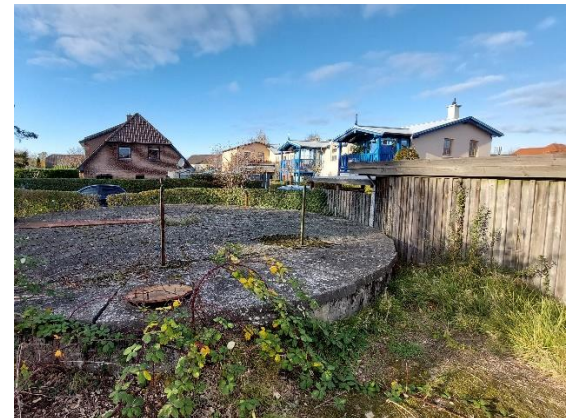
Angrenzende Bebauung entlang der Schlossstraße.