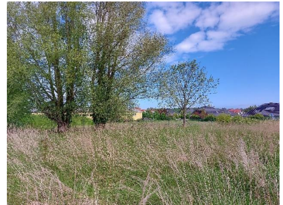
Blick aus der östlich angrenzenden Grünfläche. Im Hintergrund, die Wohnbebauung im Achterstieg.