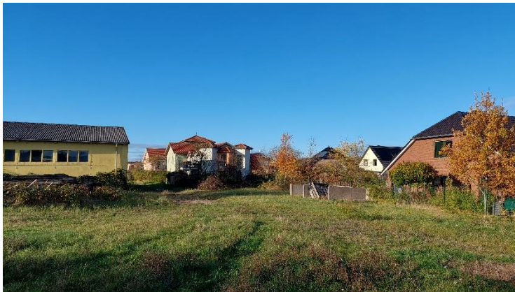
Nordwestlicher Bereich des Plangebietsrandes mit dem Übergang zur angrenzenden, dreigeschossigen Bebauung.