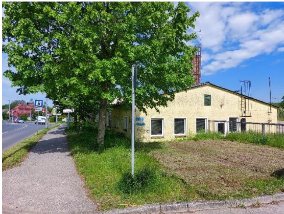
Blick in Richtung Nordwesten entlang der Schlossstraße mit Bestandsgebäude und zu erhaltender Baumreihe.

Im angrenzenden Bebauungsplan Nr. 33 sind allgemeine Wohngebiete gemäß § 4 BauNVO festgesetzt. Auch das angrenzende Gebiet entlang der Schlossstraße, für das kein Bebauungsplan existiert, hat sich zu einem faktischen allgemeinen Wohngebiet entwickelt.