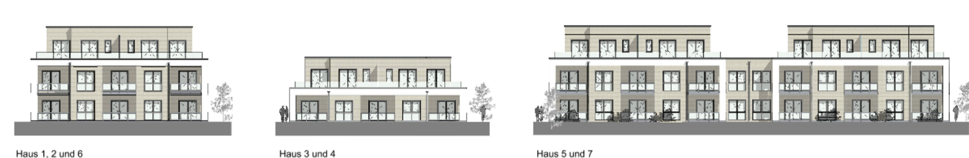
Haus 1, 2 und 6