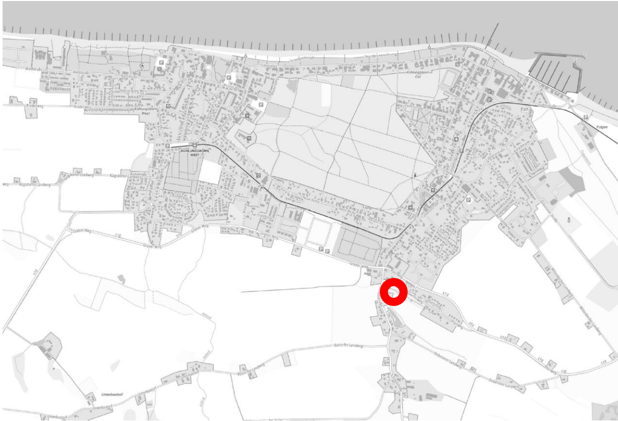
Lage des Standortes in der Ortslage