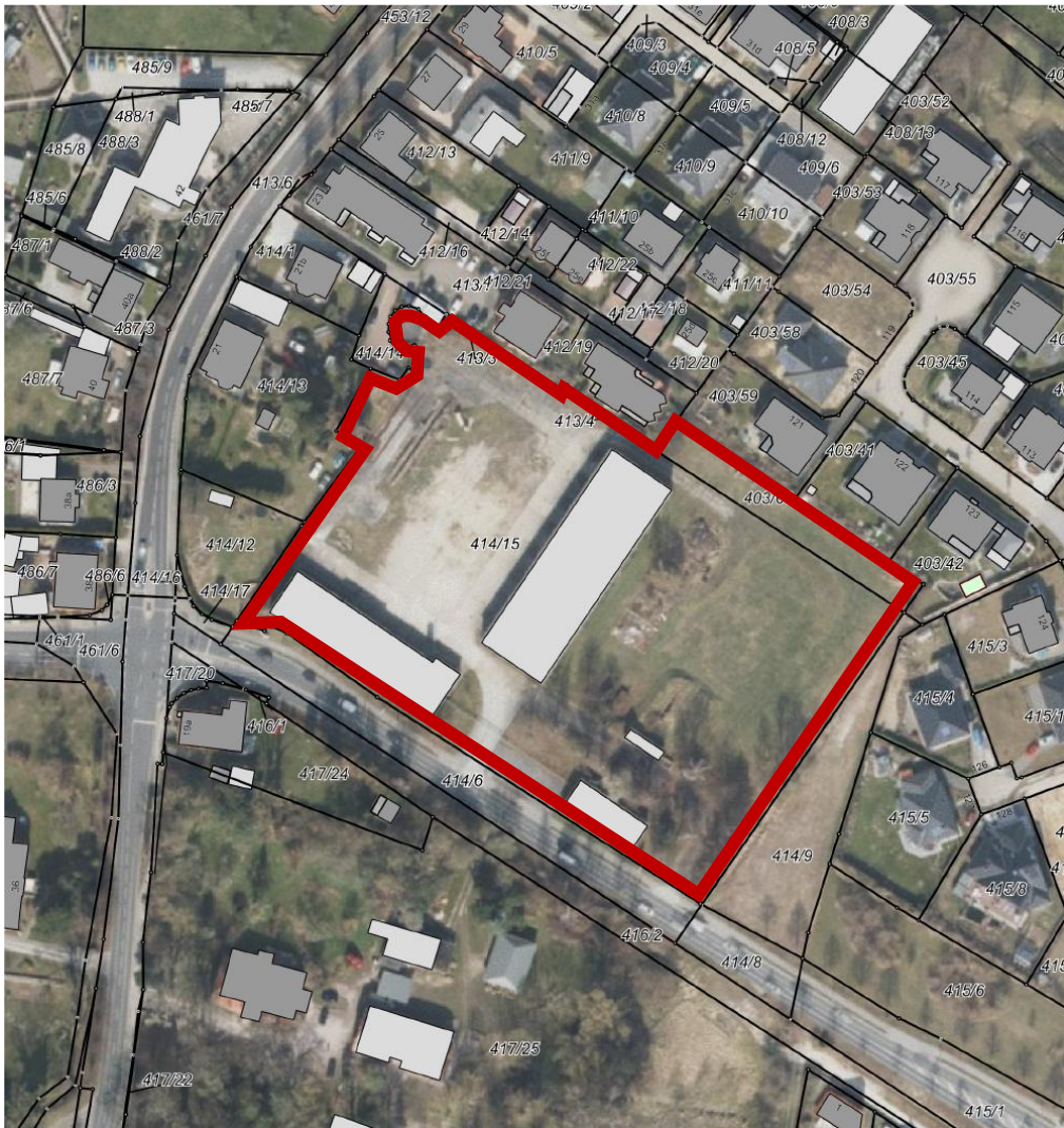
Luftbild mit Geltungsbereich

Der Geltungsbereich des Bebauungsplanes umfasst vollständig den Bereich des Vorhaben- und Erschließungsplanes. Eine Einbeziehung weiterer Flächen gemäß § 12 Abs. 4 BauGB erfolgt nicht.