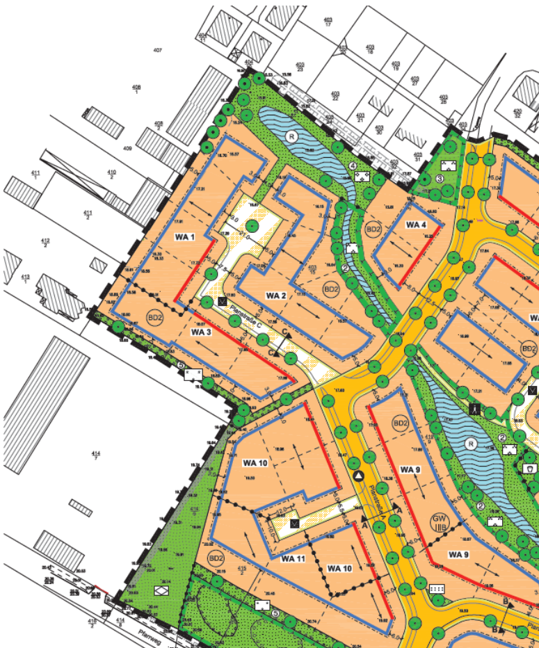
Auszug aus dem Bebauungsplan Nr. 33 „Achterstieg II“

Im östlichen Bereich grenzt der vorhabenbezogene Bebauungsplan Nr. 10 an den Geltungsbereich des Bebauungsplanes Nr. 33 „Achterstieg II“ an.